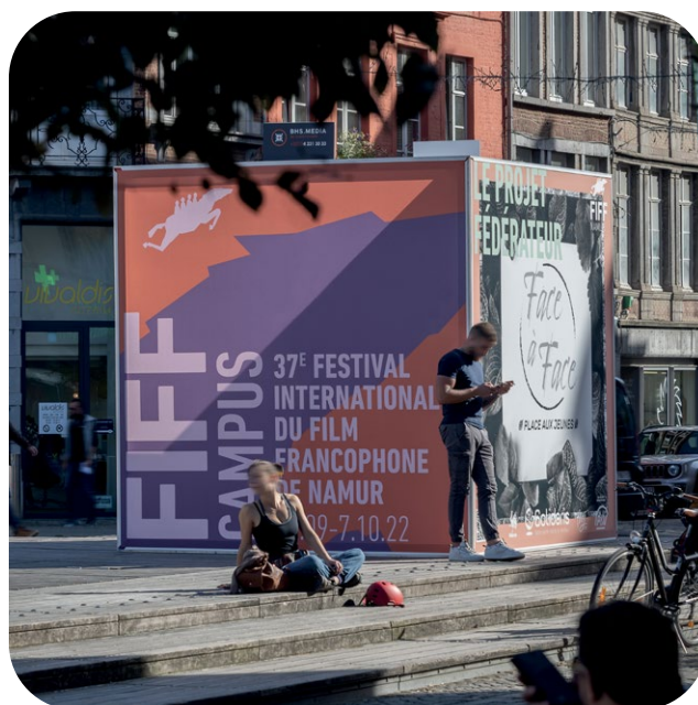
Exemple d'utilisation d'un cube 3x3m