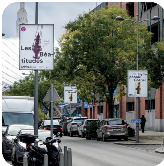
Exemple d'utilisation TopBoard.