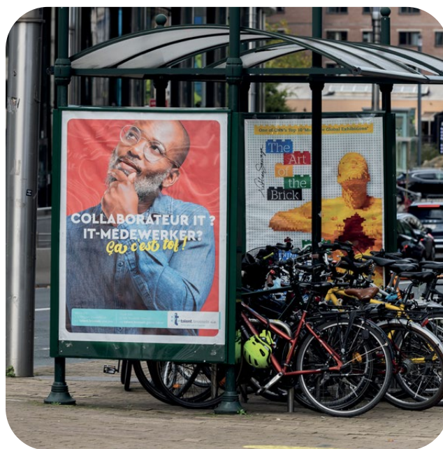
Exemple d'utilisation sous Metro Outdoor.