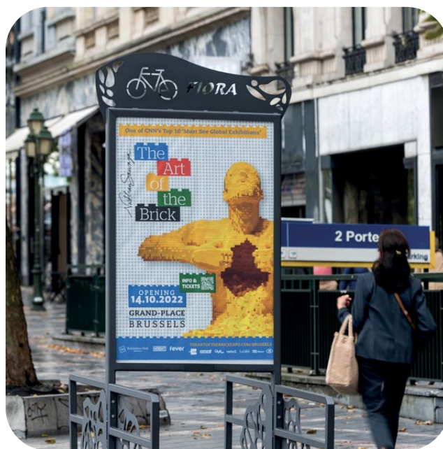
Exemple d'utilisation sous cadre Range-cyclos Fiora.