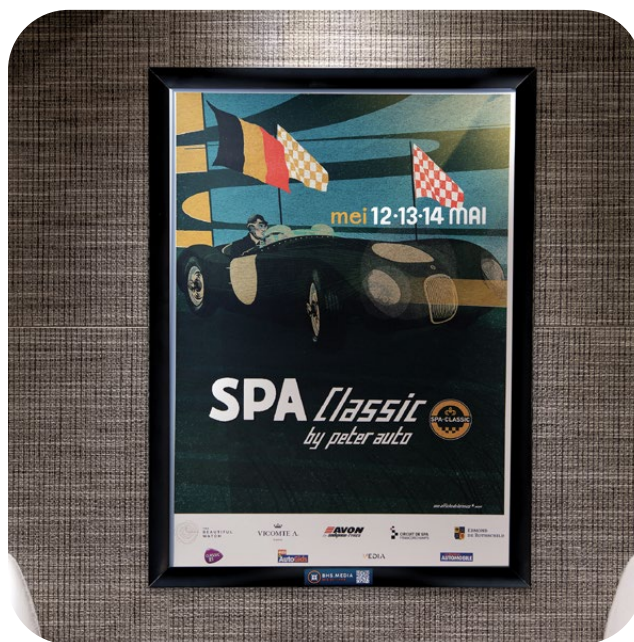
Exemple d'utilisation sous cadre City Indoor.