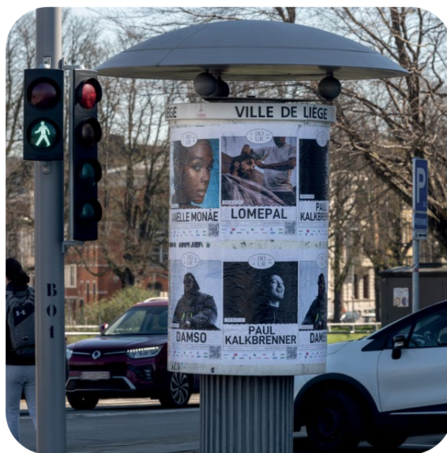
Exemple d'affichage Colle