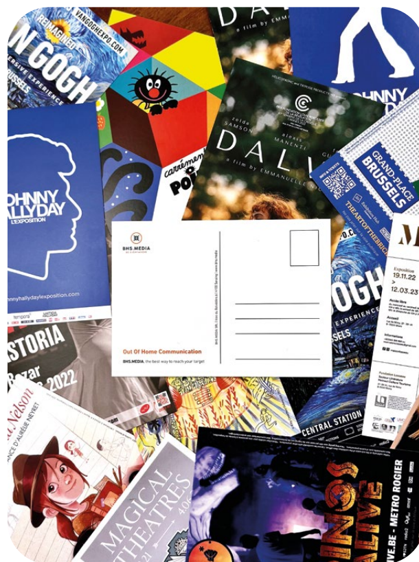
Verso carte postale BHS.MEDIA